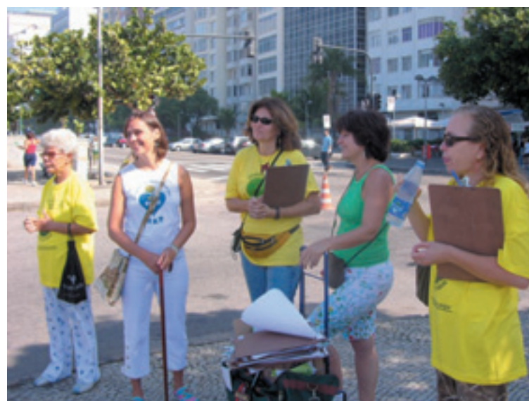
Voluntárias (acima) reúnem-se para coletar assinaturas em Copacabana